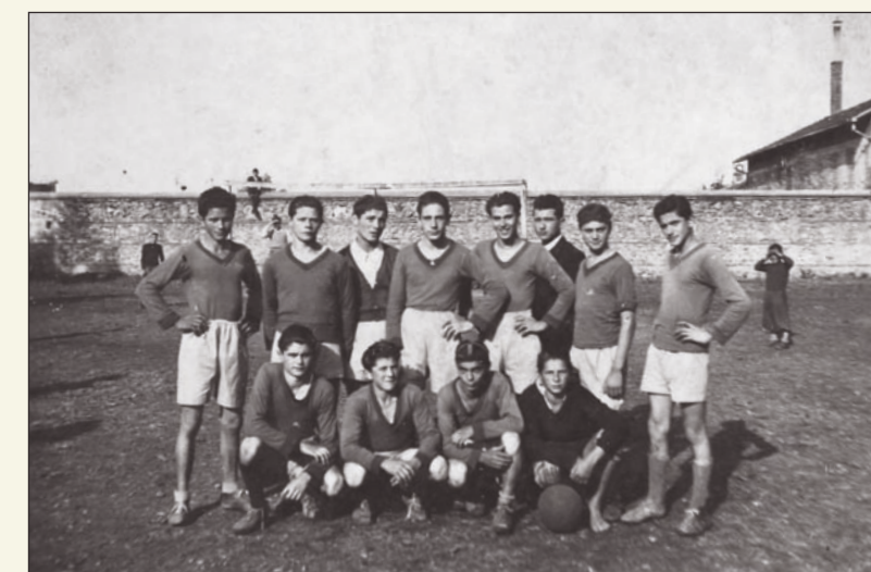
Sopra: una delle innumerevoli squadre di calcio che hanno giocato sul campo dell'Oratorio.