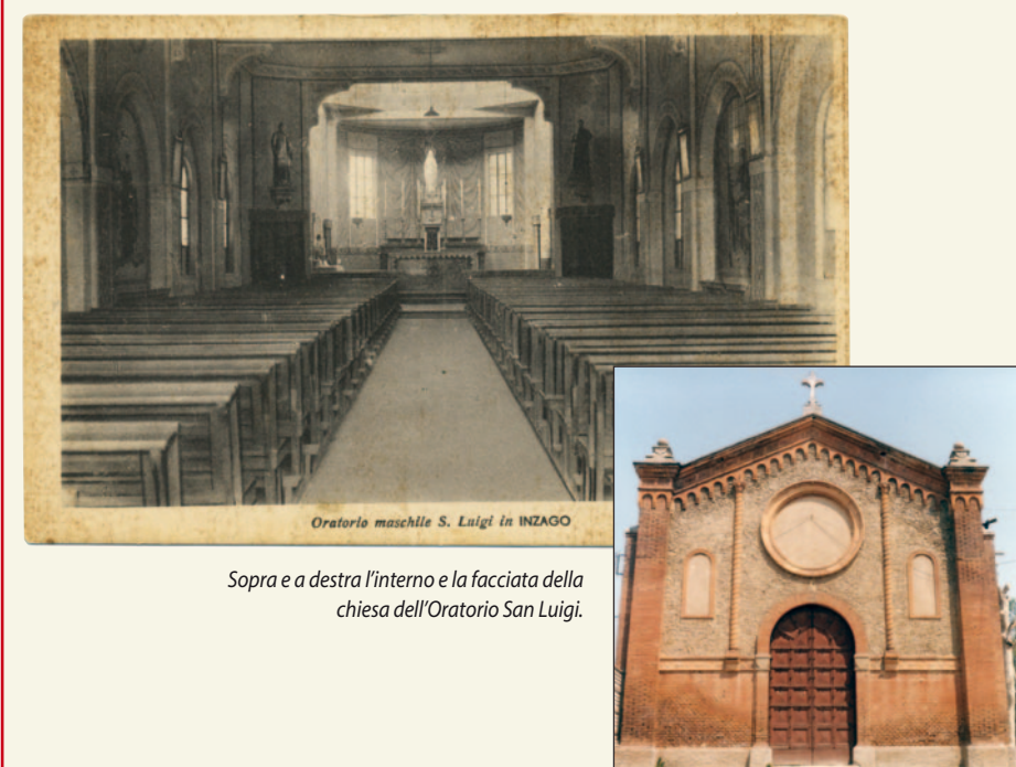
Sopra e a destra l'interno e la facciata della chiesa dell'Oratorio San Luigi.

L'automobile, rincorsa dai ragazzi, attraversava il cortile per fermarsi davanti al botteghino: dove oggi, sarà pure un caso, tra i platani di allora c'è un parcheggio pubblico.