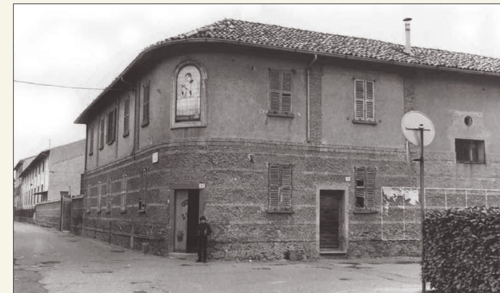
Sotto: l'entrata dell'Oratorio San Luigi all'angolo tra via Friz e via Fumagalli. Nella pagina accanto una panoramica del cortile dell'Oratorio senza la Chiesa ormai già abbattuta.