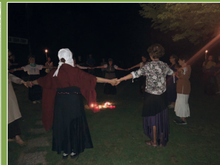
Danze durante la Camminata serale in compagnia delle streghe